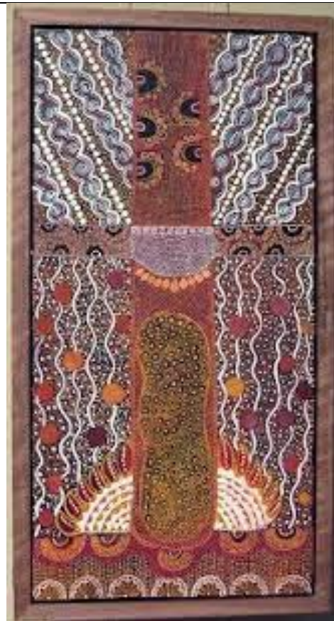
Thập Giá và Bí tích Thánh Thể